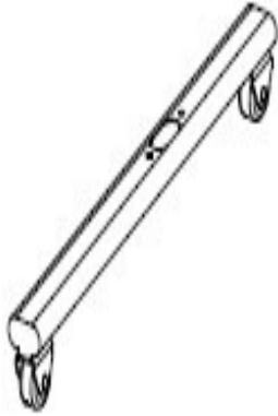
Figura 1 Soporte base